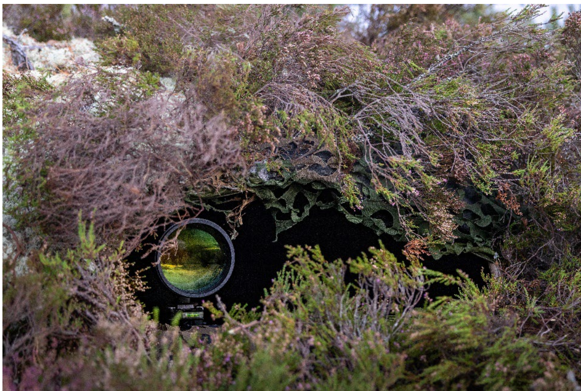
Operation Mastermind, Utö.

Försvarmakten har under 2024 fortsatt anpassat verksamheten till det försämrade omvärldsläget. Efter att Sverige blivit medlem i Nato har arbete genomförts för att integrera Försvarmakten i Nato. Under året har Försvarmakten arbetat med att stärka förmågetillväxten genom ytterligare utveckling av ändamålsenligt ansvar och mandatfördelning i myndigheten och utvecklad samverkan mellan Försvarmakten, Försvarets materielverk och Fortifikationsverket. Inom det förebyggande arbetet har det även under året genomförts olika typer av utbildningar, informationsinsatser, kontroller och uppföljningar. Försvarmakten genomförde i mitten av mars 2024 en konferens i syfte att höja myndighetens generella kompetens gällande intern styrning och kontroll. Fokus för konferensen 2024 var riskhantering och korruption i krig. Därutöver genomfördes regelbundna möten och utbildningstillfällen löpande under året för att öka medvetenheten inom myndigheten avseende regelfosterlevnad och oegentligheter.