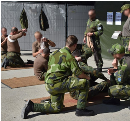
Stöd till Ukraina omfattade stöd med sjukvårdsutbildning.

Försvarsmakten har sedan februari 2022 kontinuerligt följt kriget och inhämtat erfarenheter och information från samarbetsländer, ukrainska företrädare och relevanta myndigheter, särskilt Totalförsvarets forskningsinstitut och Försvarshögskolan. Regeringen gav Försvarsmakten den 13 juli 2023 i uppdrag att inkomma med en redovisning av erfarenheter och lärdomar från kriget i Ukraina och hur dessa kan tas tillvara i Försvarsmaktens verksamhet och den fortsatta utvecklingen av det militära försvaret. En delredovisning av uppdraget genomfördes den 2 november 2023 34 och uppdraget slutredovisades den 31 maj 2024. 35