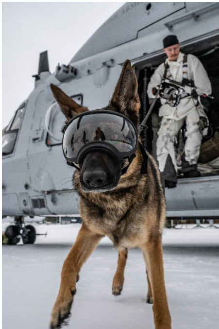
Flygning på hög höjd med hund.

Samtliga flygsystem nyttjades i stort enligt plan. Likt tidigare år var behovet av flygtid större än produktionskapaciteten, vilket begränsade förmågeutvecklingen inom främst helikoptersystemen.