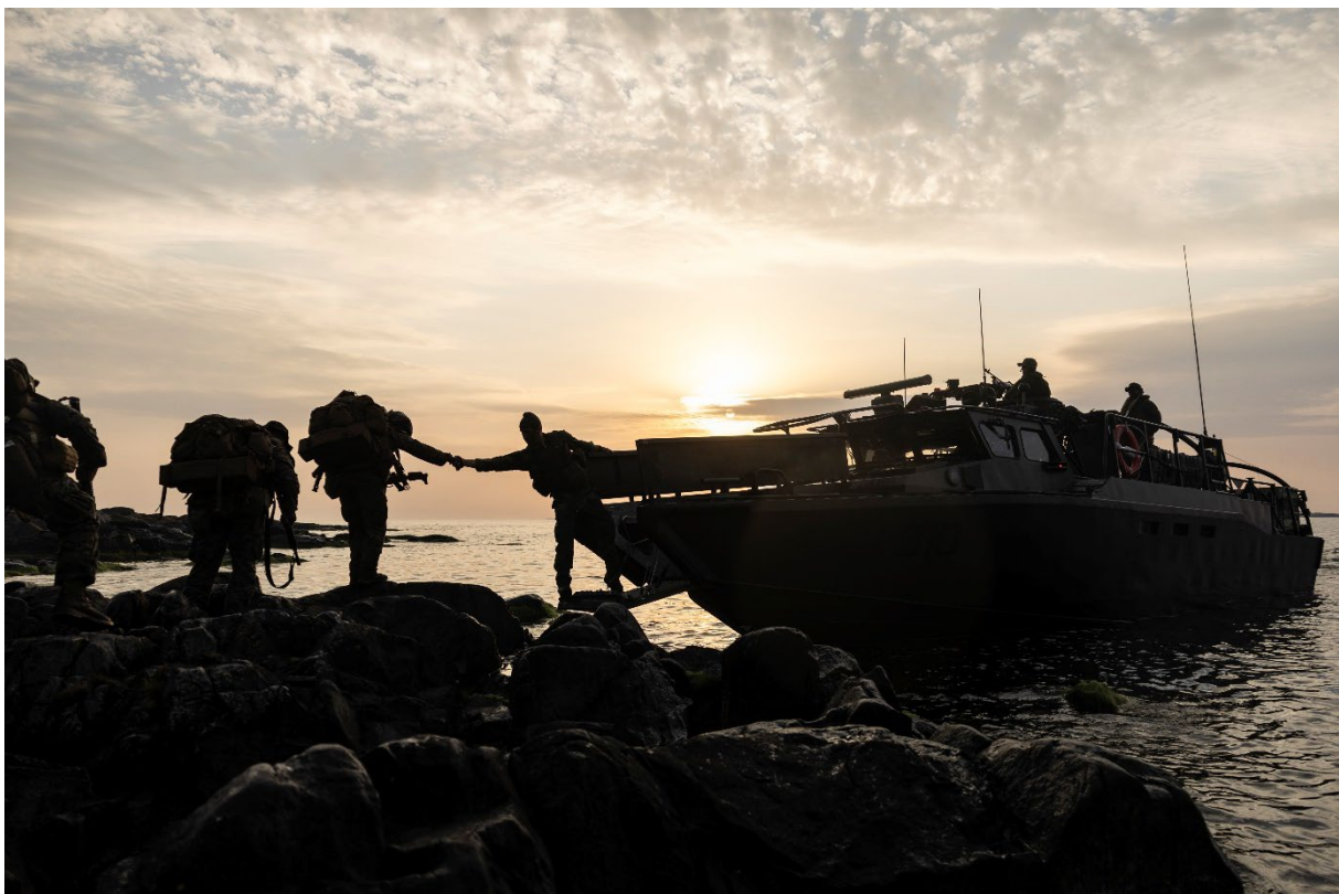
Amf 1 robotpluton samövar med US Marine Corps under Archipelago Endeavour 24.

Försvarsmakten deltar i flera internationella forum och samverkansgrupper inom bland annat EU och Nato i enlighet med Förordning (2007:1266) med instruktion för Försvarsmakten. Dessa forum har bidragit till en ökad kunskap och har möjliggjort erfarenhetsutbyte.