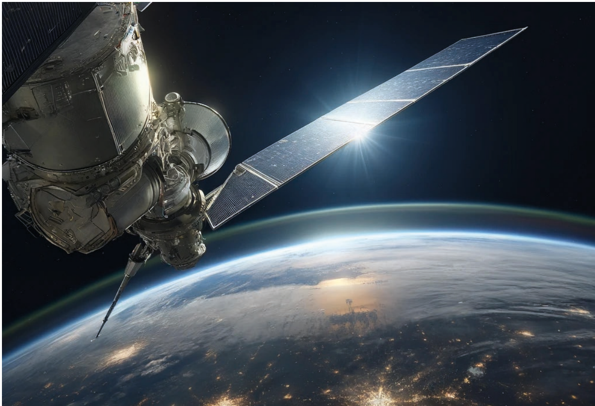
Satsning på nya rymdförmågor.

Inom området rymdsystem bedrevs forskning inom rymdlägesbild, övergripande kunskap om satelliter samt spaning och övervakning från rymden. Studier genomfördes inför fysiska prov för inmätning av satelliter som en del av en militär rymdlägesbild. Därutöver påbörjades ett arbete med ett bilateralt demonstrationsprojekt med Danmark inom rymdbaserad datahantering. De områden som rymdsystem innehåller är alla starkt knutna till den planerade och kommande materielanskaffningen som syftar till att ge Försvarsmakten förmågor inom bland annat rymdlägesbild samt spaning och övervakning från rymden.