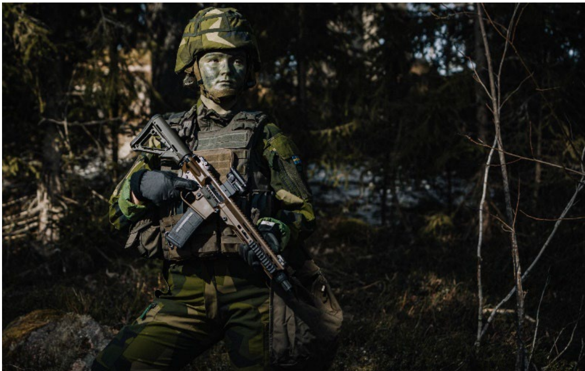
Ny automatkarbin 24 levererades från FMV under året.

Försvarsmaktens materieförsörjning under 2024 påverkades starkt av det säkerhetspolitiska läget och kriget i Ukraina, vilket ledde till ökad efterfrågan på försvarsmateriel och utmaningar med långa ledtider. Regeringsuppdrag om att förbättra tilldelning av personlig utrustning och gruppmateriel i organisationen resulterade i flera delredovisningar och slutsatsen att en handlingsplan behöver tas fram som systematiskt omhändertar utmaningar inom området. Satsningar på återanskaffning och lageruppbyggnad av reservdelar bidrog till ökad tillgänglighet av materiel, trots fortsatta svårigheter med äldre system. Förbättringar i försörjningskedjor och samarbete mellan myndigheter prioriterades för att möta kraven på förmågetillväxt. Fokus låg även på att åtgärda tidigare identifierade brister genom handlingsplaner och systematiskt arbete för att stärka krigsförbandens tillgänglighet.