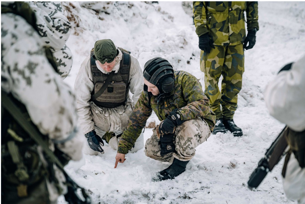
FISE under Nordic Response 24.

Inför den politiska styrningen av FISE-samarbetet för perioden 2025–2030 ( Joint Action Plan 2025-2030 ) fick respektive försvarsmakt uppgiften att ta fram ett FISE-gemensamt militärt råd. Denna uppgift överlämnades den 29 november 2024 till respektive försvarsdepartement.