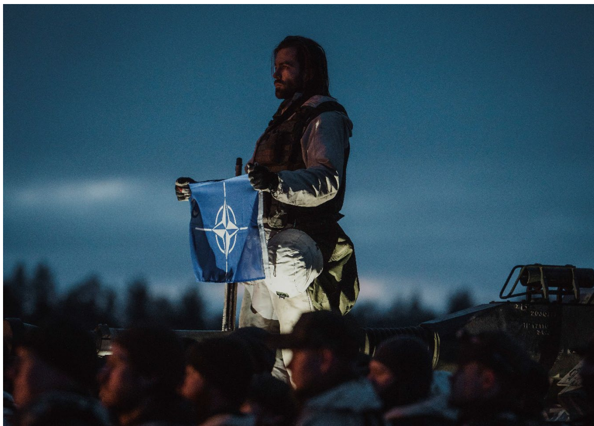
Den 7 mars 2024 började himlen skymma över de svenska markstridskrafterna i Nordic Response i finska Lappland. Då kom det plötsliga beskedet om Sveriges inträde till NATO vilket föranledde flera spontana ceremonier i övningsmörkret. Bilden är tagen vid en av dessa spontana ceremonier som genomfördes av P 7:s pansarskyttekompani.