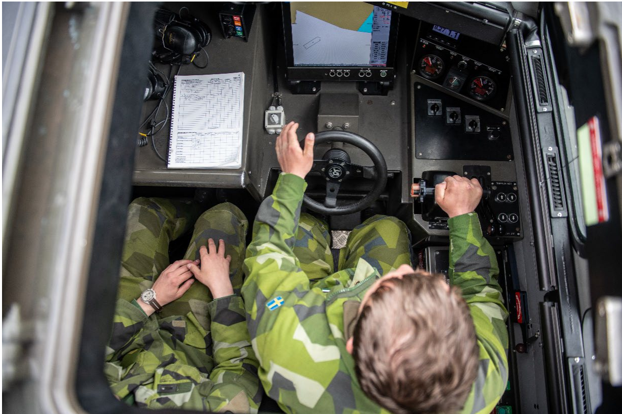
Stöd till Ukraina omfattade bland annat skänkta stridsbåtar.

Under året har Försvarsmakten fortsatt att stödja Ukraina med ett flertal stödpaket innefattande materiel som ammunition, pansarvärnsvapen, luftvärnsvapen samt materielsystem i form av stridsbåtar, pansarbandvagnar samt radarspanings- och ledningsflygplan. Utöver detta genomfördes kontinuerliga leveranser av reservdelar och utbytesenheter genom den etablerade försörjningslösningen för överlåtna materielsystem till Ukraina. Materielstödet genomfördes i form av omfattande logistikoperationer där samtliga försvarsgrenar var delaktiga.