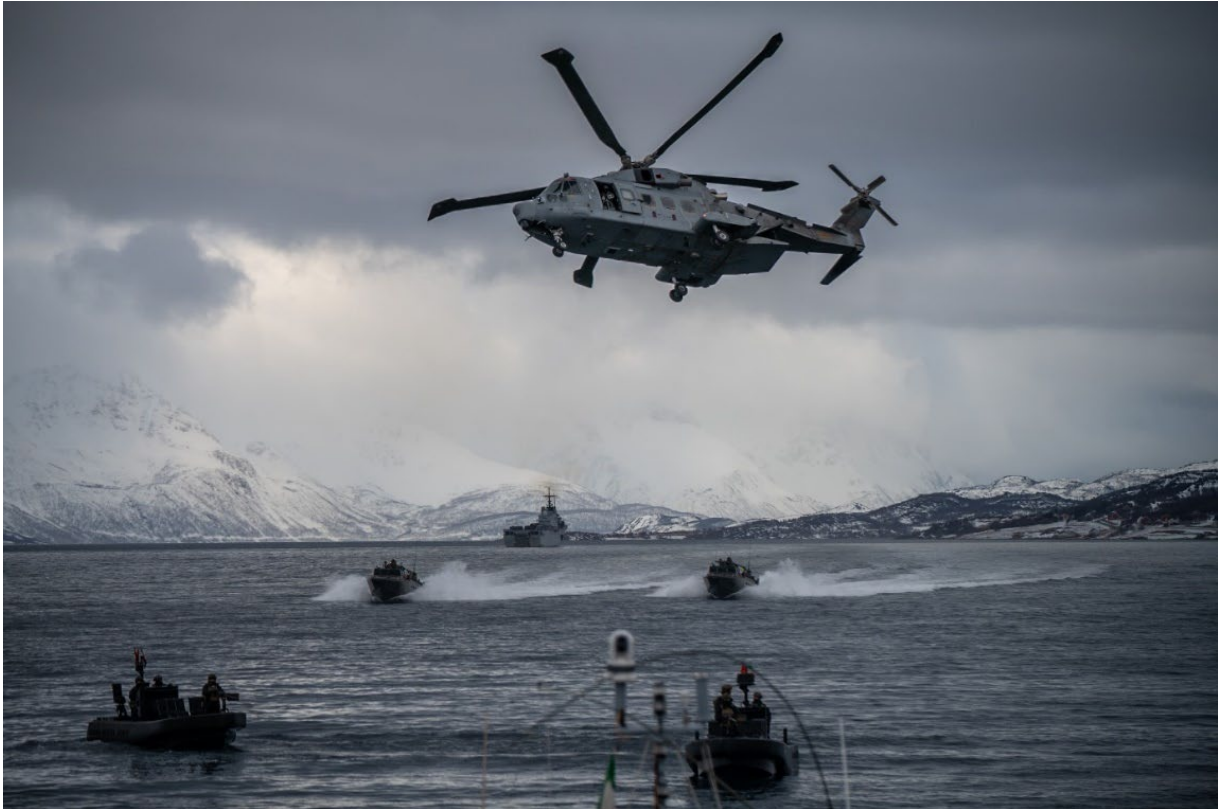
Marinens deltagande i Nordic Response 24 .