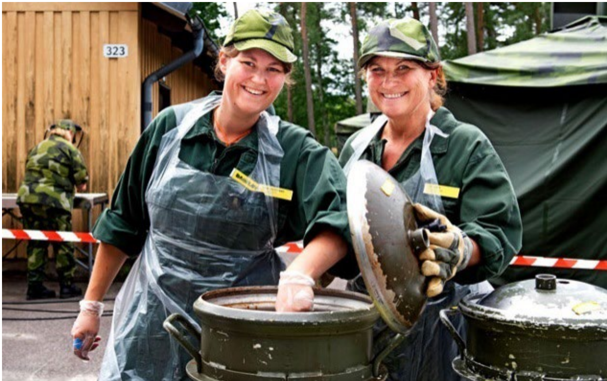
Svenska Lottakåren (SLK) utbildar fältkockar till Hemvärnet. SLK fyllde 100 år under hösten.

Tillförsel av förbandsmateriel och hantering av personlig utrustning för hemvärnssoldater var faktorer som skapade hög arbetsbelastning främst för utbildningsgrupperna. Vissa kritiska funktioner i de regionala staberna hade vakanser och utgör fortsatt den största utmaningen och risken för krigsförbanden och verksamheten i stridskraften.