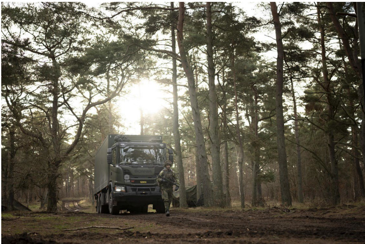
Transport under FLF Creval 24.

Försörjningslösningen för stödet till Ukraina bygger huvudsakligen på att Försvarsmakten bistår med visst underhåll och reparation. Flera av de aktiviteter som genomfördes var unika och ledde till värdefulla erfarenheter av hur krigsskadad materiel ska tas om hand. Stridskraften bemannade det internationella donationssamordningscentret (IDCC) 9 och Remote Maintenance and Distribution Cell – Ukraina (RDC U) 10 samt deltog i beredningen av Ukrainas önskemål om försvarsmateriel.