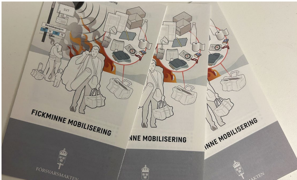
Fickminne mobilisering.

De erfarenheter som samlats in under året utgör en värdefull grund för att vidareutveckla det svenska beredskapssystemet, med målet att fullt ut integrera det i Natos strukturer och processer. Detta arbete förbättrar inte bara Sveriges egen mobiliseringskapacitet, utan bidrar även till att förstärka alliansens gemensamma avskräckningsförmåga och operativa effektivitet.