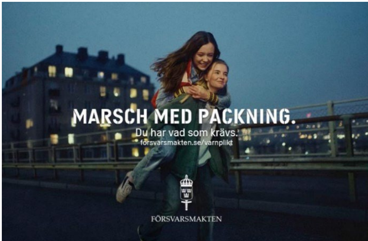
Rekryteringskampanjen Unga Kvinnor.

Under året påbörjade drygt 7 300 värnpliktiga sin grundutbildning, vilket överskred målsättningen. Rekordmånga sökte till officersprogrammet vid Försvarshögskolan och i augusti var det nära 300 kadetter som påbörjade sin utbildning till officer. Antalet anställda, både civila och militära, ökade under året och antalet avgångar var få. Trots att antalet anställda ökat är det dock fortsatt svårt att rekrytera vissa kompetenser inom exempelvis it, logistik och teknik. Inträdet i Nato medförde att fler befattningar vid de olika Natostaberna bemannades med framför allt officerare.