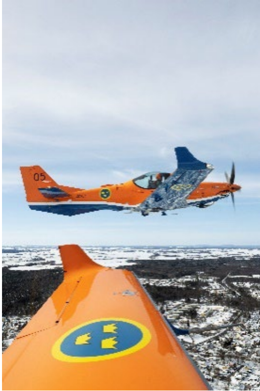
Flygskolan i Linköping flyger SK 40.

Efterfrågan på flygplan 100 var fortsatt stor avseende radarspaning och transportflygningar. Under 2024 producerades flygtid i nivå med föregående år. Trots relativt få flygplan, brist på tekniker och problem med föråldrad materiel nådde tillgängligheten efterfrågad nivå genom att underhållet utfördes av extern part. Reservmaterielanskaffning anpassades i syfte att motverka de tillgänglighetsproblem som ett föråldrat flygsystem kan medföra.