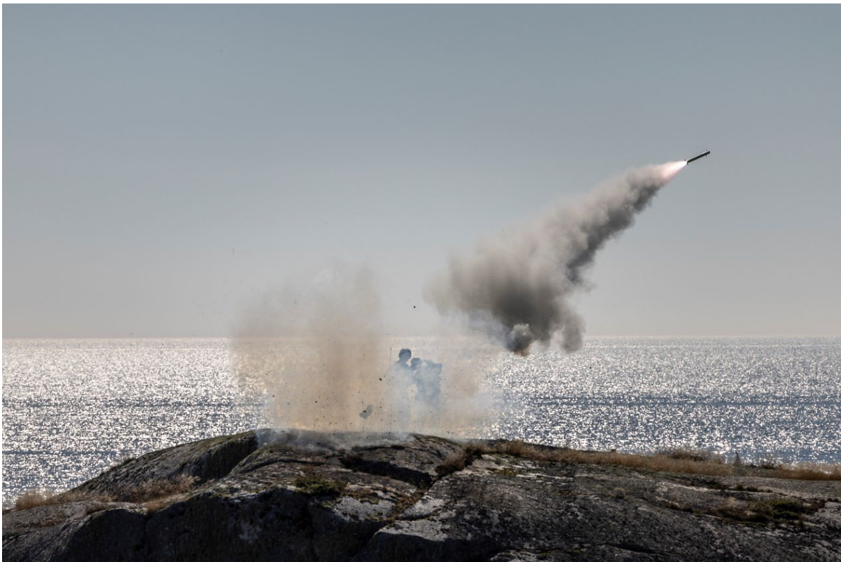
Archipelago Endeavour 24, samövning med US Marine Corps. Skjutning med en Stinger 157.

Under 2024 påbörjades utveckling mot ett gemensamt koncept för förmågevärdering i Försvarsmakten. Syftet är att ta fram direktiv för hur förmågan hos krigsförband, funktioner och ledningar ska mätas och redovisas baserat på Natos förmågekrav och ramvillkor.