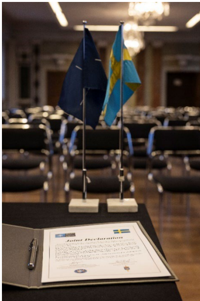
Nato Integration Conference.