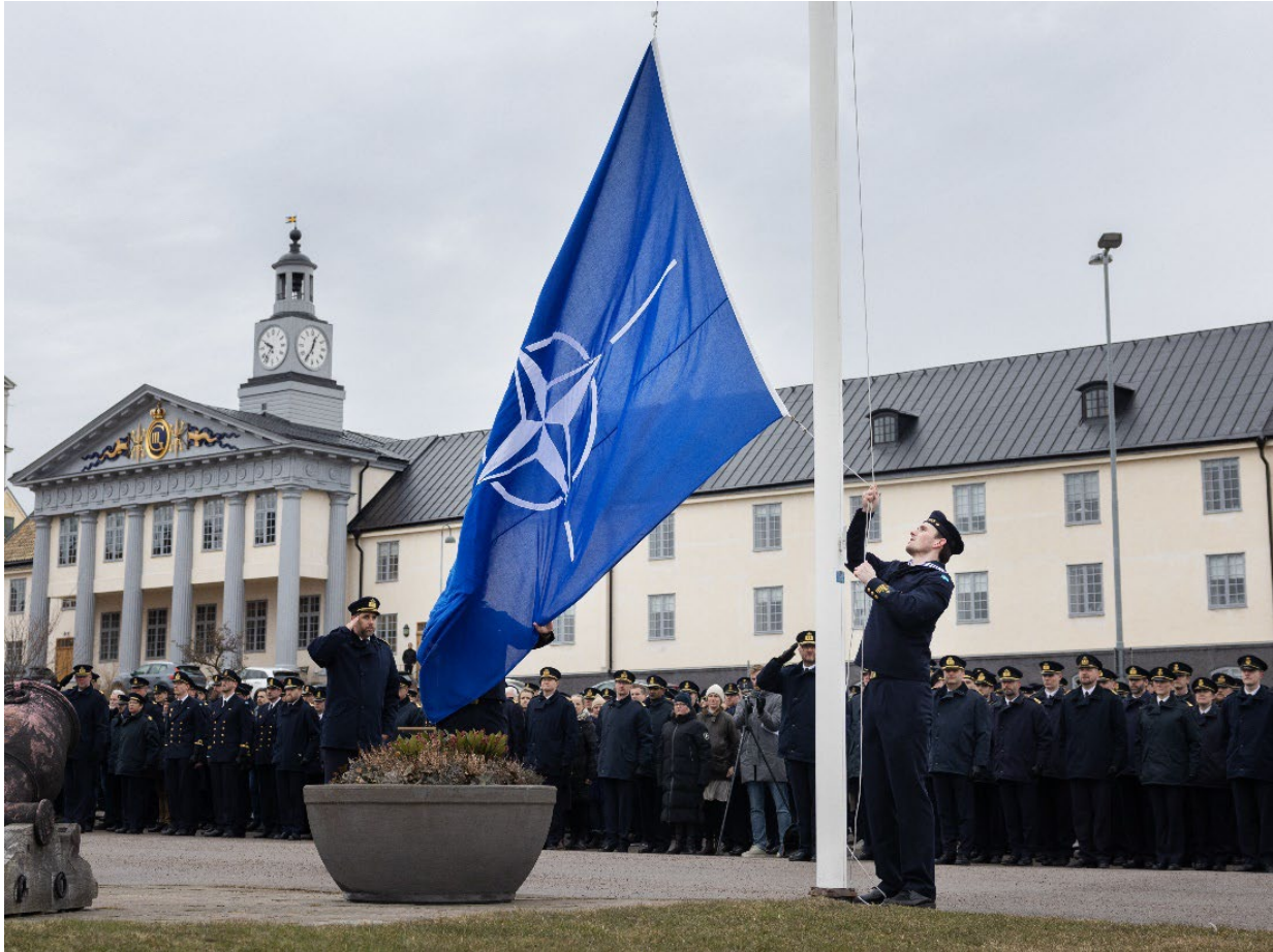
Natoceremoni i Karlskrona.

Inom infrastrukturförsörjningen ökade mängden förvärv jämfört med tidigare år. Markförvärv genomfördes för att utöka förrådskapaciteten för att omhänderta genomförd materielanskaffning. Försvarsmakten har tillsammans med Fortifikationsverket genomfört en omfattande utveckling av arbetet med lokalförsörjning.