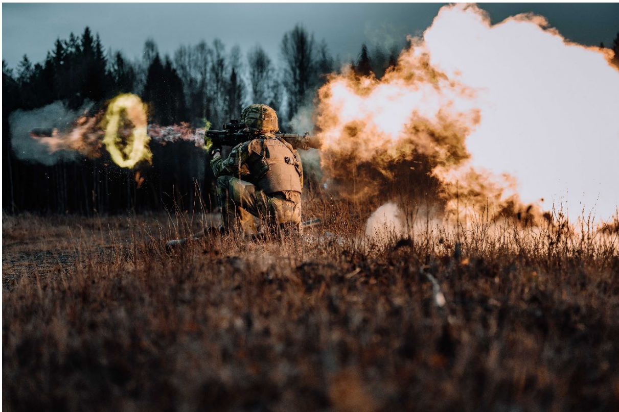
Skjutning med Grg 18 på Kusträsk skjutfält utanför Boden.

Armén upprätthöll under 2024 både nationell och internationell beredskap samt deltog i ett antal beredskapsoperationer. Som en effekt av Sveriges medlemskap i Nato inleddes även förberedelser för att upprätthålla beredskap inom alliansen. Armén deltog även i ett antal mindre samt i en mer omfattande beredskapskontroll, dessa beskrivs i den hemliga resultatredovisningen (bilaga 3).