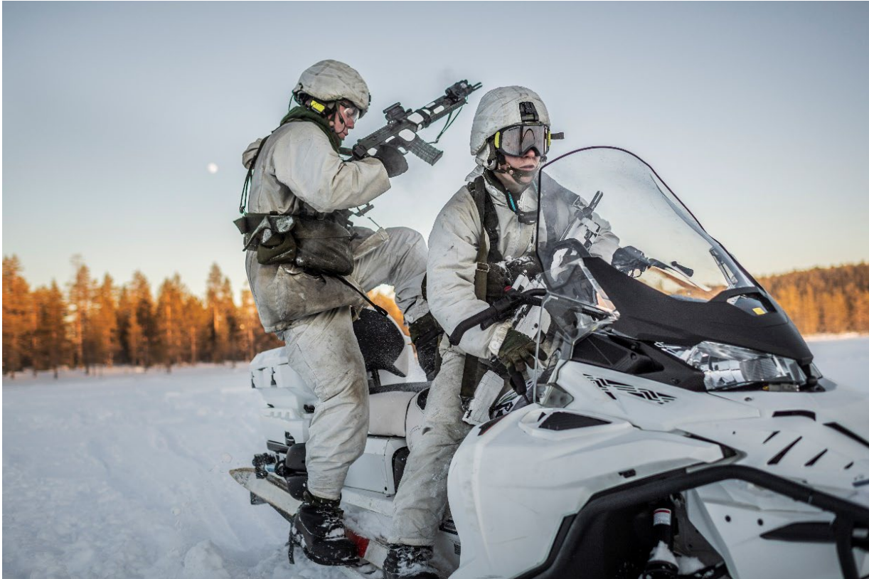
Skoterkörning utanför K 4 i Arvidsjaur.