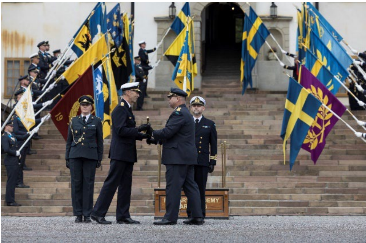
ÖB överlämningsceremoni genomfördes den 1 oktober 2024 på Karlbergs slott i Stockholm. Under hösten bytte Försvarsmakten överbefälhavare från Micael Bydén till Michael Claesson.

Försvarsmaktens volym och förmåga ökar. Det stärker i sin tur alliansens gemensamma avskräckning och försvar.